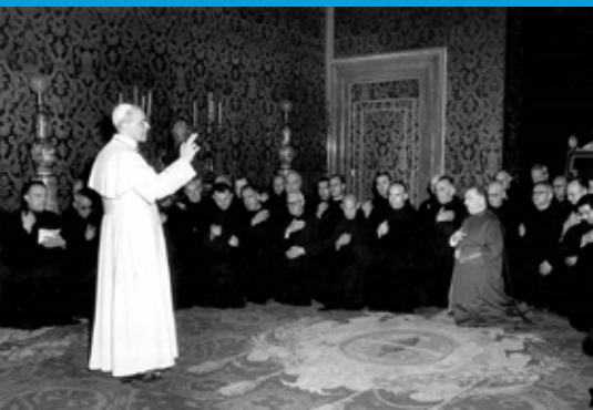
Papież Pius XII witający uczestników Kapituły Generalnej

jego harmonię z Kościołem oraz społecznościami, w których działali. Aby lepiej zrozumieć i promować ideę szpitalnictwa, postanowiono stworzyć dokumenty referencyjne, takie jak statut czy zasady duchowości inspirowane stylem św. Jana Bożego.