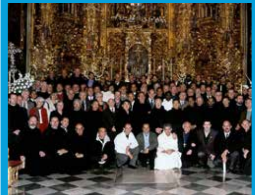
Kapituła Generalna w Granadzie, 2006 r.

Kapituła zyskała dodatkowy wymiar od 2006 roku dzięki wprowadzeniu specjalnego logo i tymczasowej strony internetowej dedykowanej wydarzeniu. Umożliwia to globalnej Rodzinie Szpitalnej św. Jana Bożego wcześniejsze przygotowanie się i pozostawanie w kontakcie z członkami kapituły podczas tego kluczowego momentu. Dzięki tym inicjatywom Zakon nie tylko pielęgnuje swoje tradycje, ale również dostosowuje się do zmieniającego się świata, pozostając wiernym misji szpitalnictwa i służby drugiemu człowiekowi.