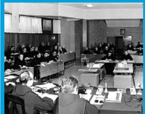
Kapituła Generalna w 1976 r.

motywów przewodnich dla kolejnych kapitul. Tematy te odzwierciedlają aktualne wyzwania i aspiracje każdej sześciolatniej kadencji, takie jak „Rodzina św. Jana Bożego w służbie szpitalnictwa” w 2012 roku czy „Budowanie przyszłości szpitalnictwa” w 2019 roku.