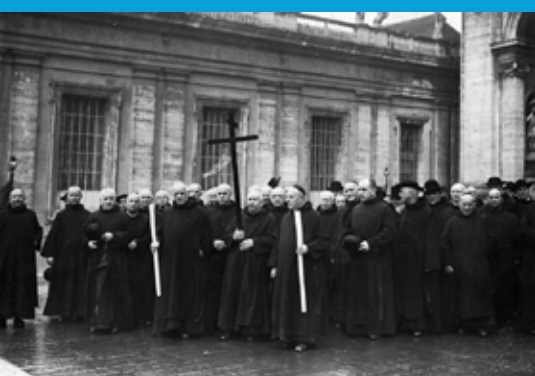
Członkowie Kapituły Generalnej z 1934 r. na placu Świętego Piotra w Rzymie

Kolejne kapitule odbywały się regularnie, chociaż ich rytm niejednokrotnie zakłócały kolejne konflikty zbrojne. Mimo tych trudności, bracia nieustannie dążyli do zachowania ducha św. Jana Bożego, rozwijając Zakon i utrzymując