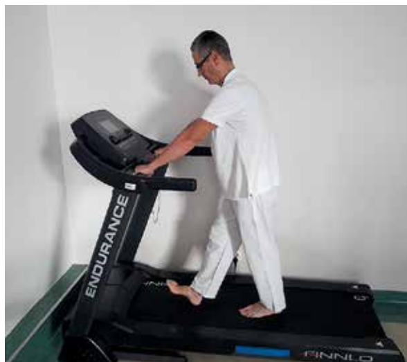
Ryc. 3. Leczenie miażdżycy tętnic kończyn dolnych – trening marszowy na bieżni

Zmiany miażdżycowe tętnic u chorych z chromaniem przestankowym są zazwyczaj uogólnione, to znaczy w różnym stopniu zaawansowania obejmują również tętnice innych narządów, takich jak serce i mózg. Zatem ćwiczenia na bieżni muszą uwzględniać zarówno korzyści, tj. wydłużenie dystansu chromania, jak i obciążenia dla układu sercowo-naczyniowego. Poprzedzenie rehabilitacji ruchowej wykonaniem jednorazowego testu wysiłkowego na bieżni z pomiarami ciśnienia tętniczego krwi (CTK), częstości akcji serca (CAS) i zapisem badania elektrokardiografem (EKG) umożliwi uchwycenie w trakcie testu zaburzeń układu krążenia i tym samym informuje o potencjalnym ryzyku rehabilitacji, jakie może stanowić pełny, wielotygodniowy program intensywnych ćwiczeń na bieżni dla niektórych osób. Nie dotyczy to chorych, o których już wstępnie wiado-