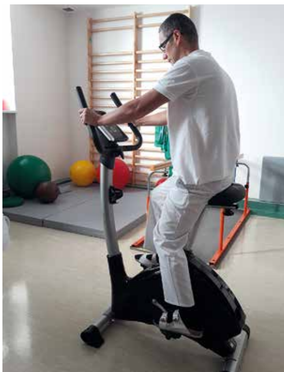
Ryc. 4. Leczenie miażdżycy tętnic kończyn dolnych – trening na ergometrze rowerowym

W piśmiennictwie można znaleźć prace, których wyniki przemawiają za tym, że trening kończyn górnych ( arm cranking ) może być wysoce korzystnym postępowaniem u chorych z chromaniem kończyn dolnych. Dotyczy to w szczególności wielu pacjentów z PAD, którzy źle tolerują marsz lub mają ograniczoną możliwość wykonywania ćwiczeń kończyn dolnych. Wykazano, że ćwiczenia kończyn górnych wzmagają potencjał antyoksydacyjny i prowadzą do wydłużenia bezbólowego i maksymalnego dystansu chromania. Z całą pewnością można oczekiwać też, że ta forma treningu przyczynia się do wzmocnienia mięśni kończyn górnych, ewentualnej normalizacji ciśnienia i usprawni układ krążenia jako całość. Obciążenie powinno być tak dobrane, aby uzyskać optymalne warunki dla trenowania układu sercowo-naczyniowego. Określa je tzw. strefa sprawności fizycznej definiowana jako 50–75% maksymalnej CAS (220 – wiek) i taki zakres uważa się za docelową czynność serca. Zwiększenie CAS powyżej górnej granicy strefy sprawności może stanowić ryzykowne obciążenie mięśnia sercowego [45, 46].